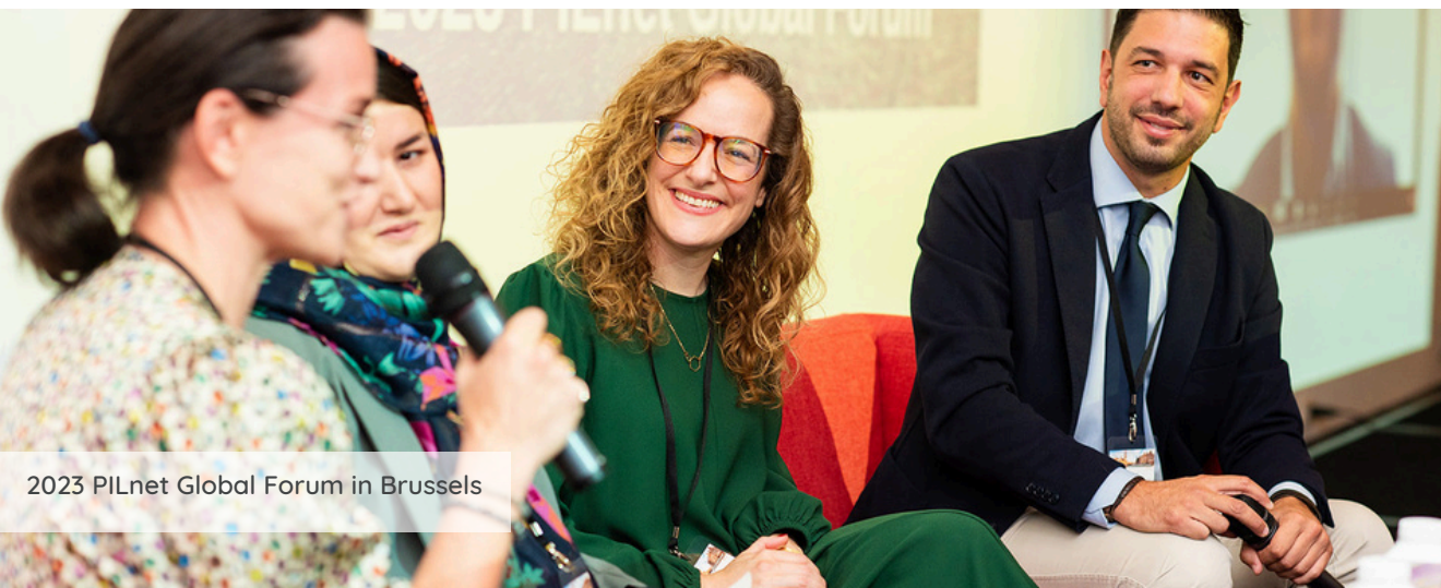
2023 PILnet Global Forum in Brussels

Посетите веб-сайт pilnet.org , чтобы узнать больше!