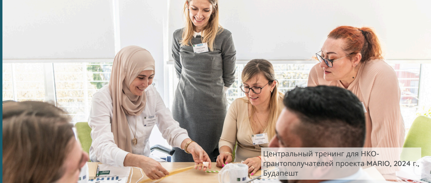
Центральный тренинг для НКО-грантополучателей проекта MARIO, 2024 г., Будапешт

PILnet сотрудничает с организациями гражданского общества, точно определяя их потребности, чтобы найти для них квалифицированного юриста, работающего на общественных началах.